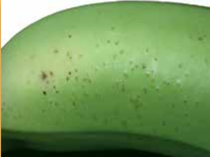
Thrips de la fleur