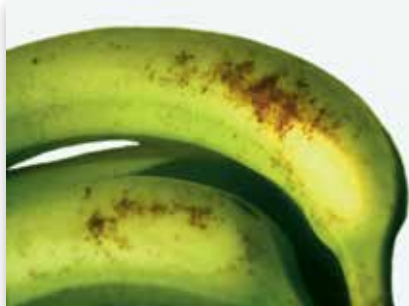
Rouille rouge (Thrips)