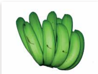
Grattage de ficelle de haubanage