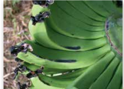
Grattage de feuille