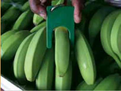
Fruit trop maigre