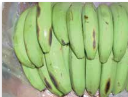
Anthraxose de blessure ou chancre