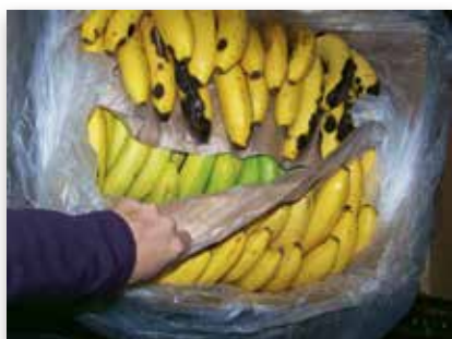
Anthraxose de quiescence