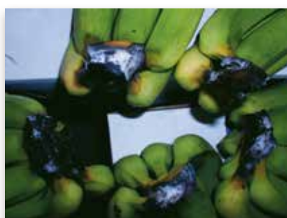
Pourriture de couronne