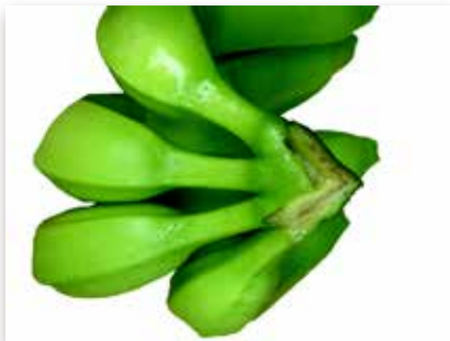
Couronne en pointe