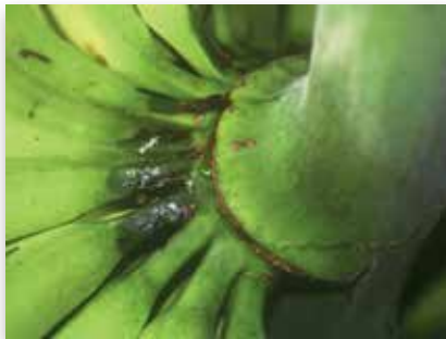
Pliure du pédoncule