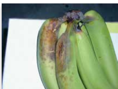
Pourriture de couronne