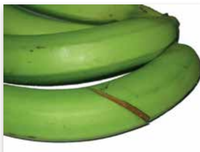
Coup de couteau