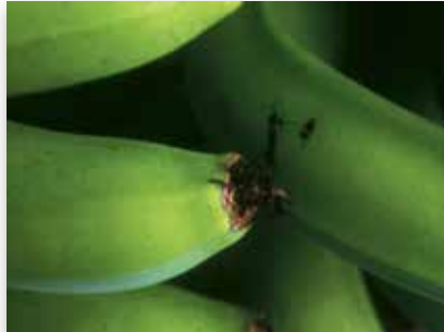
Grattage de pointe