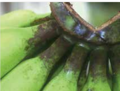
Fumagine sur pédoncule