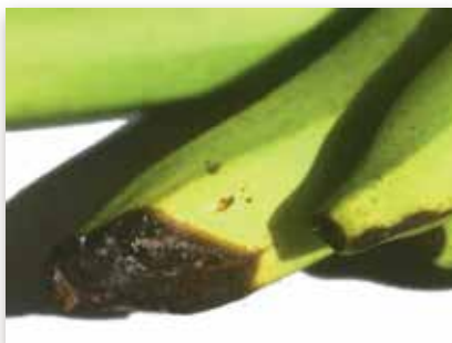
Brûlures de soleil