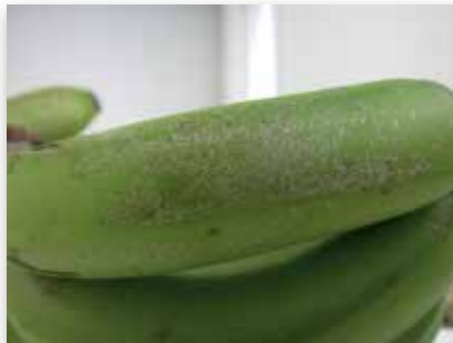
Rouille argentée (Thrips)