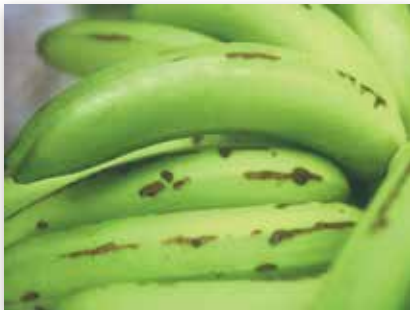
Dégâts de Diaprepes