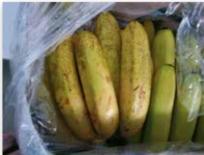
Red speckling en mûrisserie