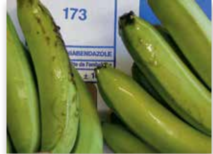
Taches de latex