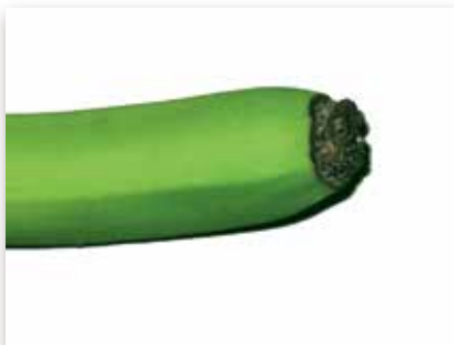
Bout de cigare