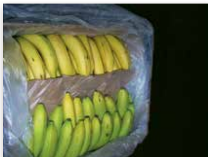
Hétérogénéité après mûrissage