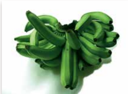
Fruit double et fruits déformés