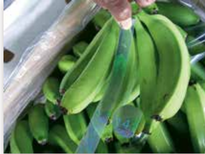
Fruit trop court