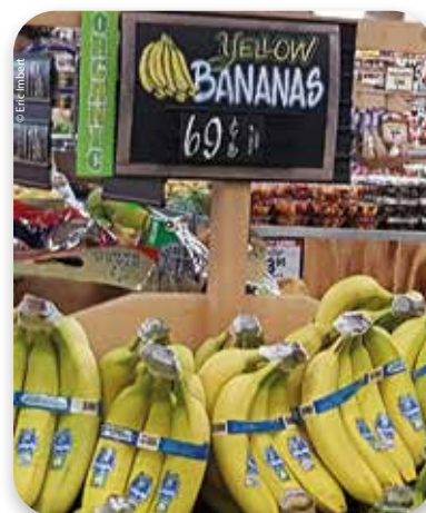
Banane - USA - Prix import spot annuel (US$/carton)

Cette hausse à l'import a été répercutée tout ou partie au stade détail dès le mois de janvier 2021. A noter l'accélération de la hausse en novembre et décembre. L'augmentation de tous les facteurs de production, dont on parle abondamment, et la période de renouvellement des contrats en sont quelques-unes des raisons. Sur l'année, le prix grimpe de 4 % pour atteindre 1.32 US$/kg, niveau jamais atteint depuis 2014. A noter toutefois que, sur les quinze dernières années, le prix de la banane au stade détail oscille autour de 1.3 US$/kg ■